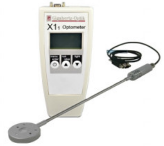
Radiómetro de curado UV con un detector independiente RCH-116-4 para la medición de lámparas LED de alta potencia en el curado por radiación UV-A y luz azul