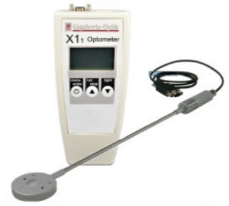
Medidor de curado UV para la irradiación LED de alta intensidad

Una de las características más destacadas del RCH-116-4 UV and Blue Light Curing Detector es su probado concepto de absorbedor de radiación pasivo acoplado a un sensor UV. Esto proporciona estabilidad incluso en entornos de alta temperatura y de intensa radiación UV y